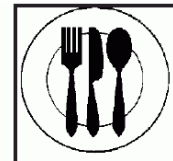
оборудование пищевой промышленности

Представленные данные являются типовыми на момент составления описания. Компания сохраняет за собой право вносить изменения. Приведенные данные характеризуются повторяемостью и воспроизводимостью при применении соответствующих методов испытаний. Информация по безопасному применению продукта содержится в Паспорте Безопасности (MSDS). Более подробную информацию о продукте и его использовании можно получить у технических специалистов компании.