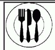
оборудование пищевой промышленности

Представленные данные являются типовыми на момент составления описания. Компания сохраняет за собой право вносить изменения. Приведенные данные характеризуются повторяемостью и воспроизводимостью при применении соответствующих методов испытаний. Информация по безопасному применению продукта содержится в Паспорте Безопасности (MSDS). Более подробную информацию о продукте и его использовании можно получить у технических специалистов компании: